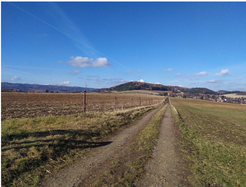
Fotodokumentace stavu po výsadbě – pohled od zvoničky u polní cesty směrem na Meziříčko