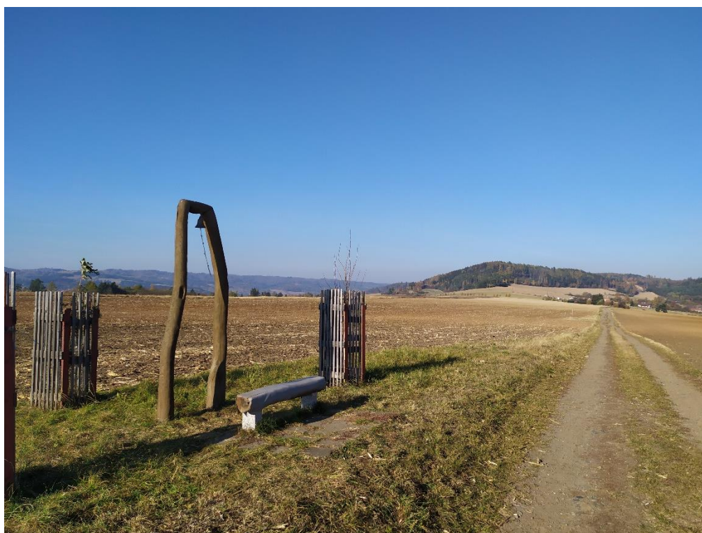
Fotodokumentace stavu před výsadbou – pohled od zvoničky u polní cesty směrem na Meziříčko