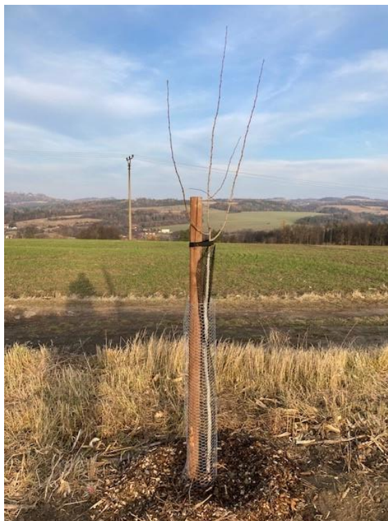
Pohled na jeden z 85 ks ovocných stromků. Stromek je opatřen kůlem, a dvojitou pletivnou ochranou proti vysokému riziku okusu zvěří.