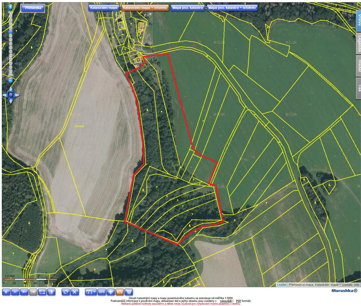
Obr. 2 Satelitní mapa registrovaného VKP Louky u Skrchova, s vyznačením průběhu hranice prvku.